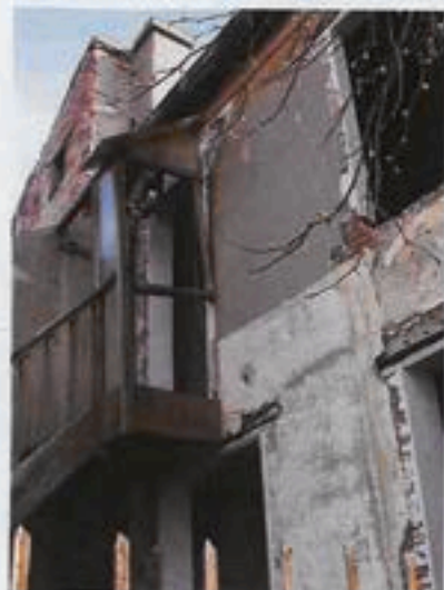
Un immeuble particulièrement dégradé de la rue des Monts.

Une déclaration d'utilité publique est une procédure légale qui permet de réaliser une opération d'intérêt public sur des terrains privés. Cette