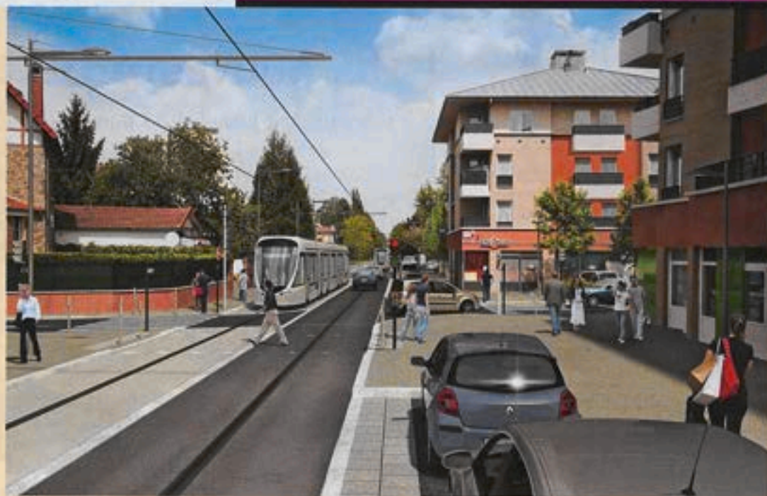
L'arrivée du tramway est prévue pour 2012.

Le city-park a été réalisé pour créer un lieu de vie pour les jeunes, sur le quartier de la Plaine. Un terrain multisports existait déjà sur le quartier mais, don-