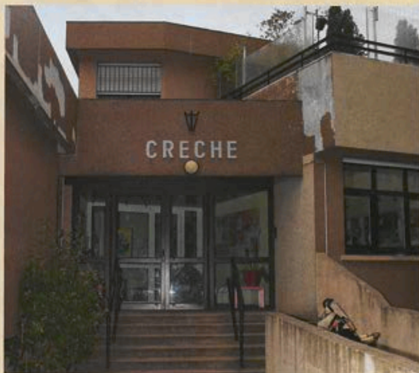
Les travaux de rénovation de la crèche vont débiter en juillet.

projet est actuellement en cours de finalisation et le permis de construire devrait bientôt être délivré. 135 logements sont prévus dont certains en accession sociale à la propriété. Basse consommation, les bâtiments comprendront des terrasses végétalisées et des panneaux solaires. Les deux projets (réalisation du parc et réalisation des immeubles) se feront