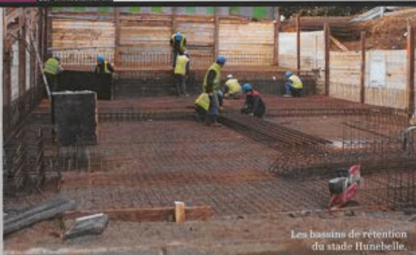
Les bassins de rétention du stade Hunebelle.

Le Conseil général des Hauts-de-Seine réalise des travaux sur l'assainissement de l'avenue Adolphe Schneider à compter du 1 er mars. Le