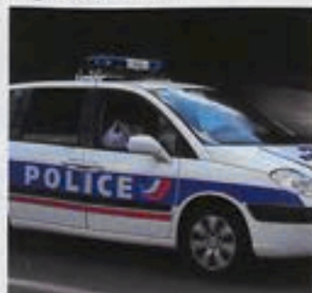
Le conseil de quartier Gare demande davantage d'effectifs de police à Clamart.